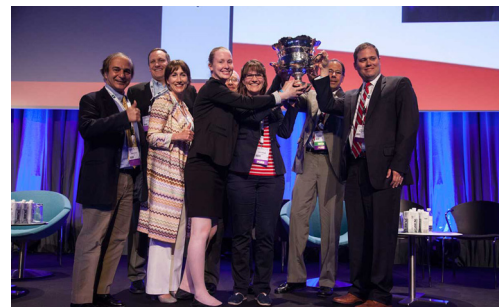
图 5 第五届 Master cup 大赛获胜者美洲队