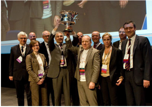
图 2 第四届 Master cup 大赛获胜者欧洲队