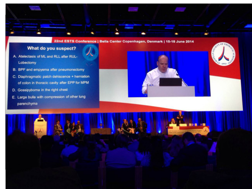
图 4 第五届 Master Cup 大赛（第一轮亚洲队 vs 美洲队）

了一个冷门。第二轮比赛亚洲队vs欧洲队，美洲队长D'Amico教授提出了难度颇高的24道赛题，两队仅仅交出了9:9的答卷。第三轮比赛，美洲队vs欧洲队，美洲队以20:18胜出。于是在三轮总分上美洲队以35分(满分48分)遥遥领先，毫无争议地率先进入决赛，而亚洲队和欧洲队则以27:27平分秋色。谁能晋级决赛？戏剧性的场面出现了！比赛规则居然是两队抛硬币！（对的，你没有看错！）历史上，秉承了文艺复兴运动之后蓬勃发展的理性科学思维以及平等公正的人文信念的欧洲绅士们也经常时不时地玩一次幽默，类似的情况在1968年举行的欧洲杯足球赛的半决赛赛场上就曾经发生过。当届东道主意大利队在那不勒斯市的圣保罗大球场与前苏联队狭路相逢，在激战了120分钟而互交白卷之后，就是以抛硬币的方式让对手饮恨而归(当时的晋级规则就是抛硬币而不是互罚点球；获胜的金手来自于意大利队长法切蒂，他也是意大利队历史上“四个最伟大的左后卫”之首，资深足球迷对此应该不会陌生)。不谙规则的亚洲队果然运气不佳，不过这也是亚洲队在历年比赛中的最佳战绩了。侥幸晋级的欧洲队在决赛中也失去了命运女神的垂青，在这场异常激烈的王者之战中8:9负于美洲队。最终美洲队第三次举起了大师杯(图5)。