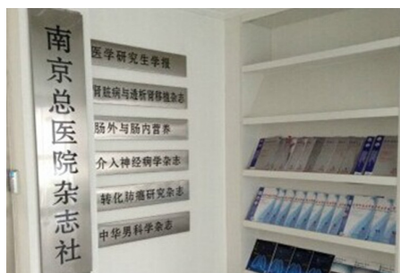
图 2 TLCR 杂志南京军区总医院编辑部办公室