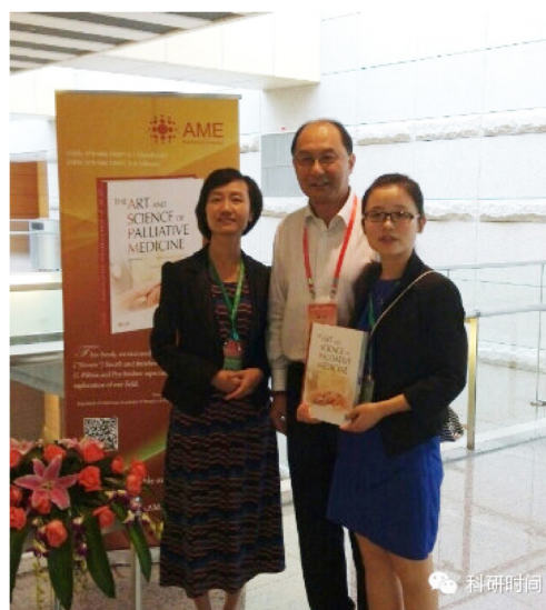
图2 与姚阳教授合影

今年的姑息会议专场，云集了国内姑息治疗领域的几位权威专家，他们将要针对相关指南进行解读，听会的同行更是早早就挤满现场。就在笔者觉得可以打道回府时(要赶当晚的飞机回穗，自以为接下来的时间将不会再有机会跟参会者介绍 ASPM)，一位戴着VIP牌子的专家来到我们的桌前，翻起了ASPM。看到VIP三个字母，直觉告诉我这位应该很厉害(当时还不认识姚阳教授，汗颜……)，于是就简单介绍起ASPM的主编、作者以及背后的故事。没想到，姚教授在浏览过书的目录后，当即说：“这是个好东西！我要买两本，一本给我自己，一本送给于世英教授！”短短两句话，确是对ASPM最大的肯定！倍感激动的我们，征得姚教授的同意后，很荣幸地与之在临时展位前合影留念(图2)。