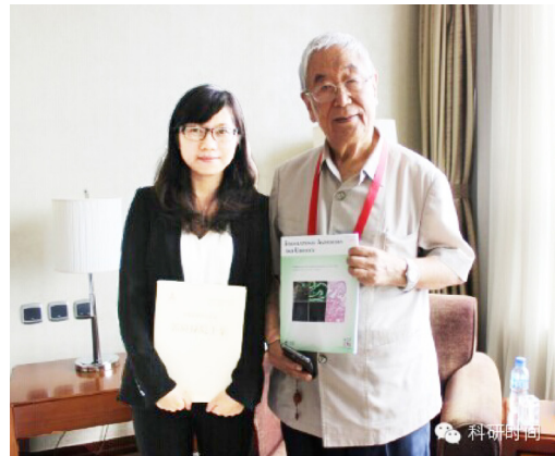
图 1 郭院士、AME 出版社编辑与 TAU 杂志合影照